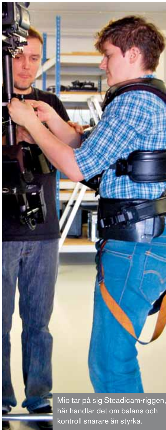
Mio tar på sig Steadicam-riggen, här handlar det om balans och kontroll snarare än styrka.